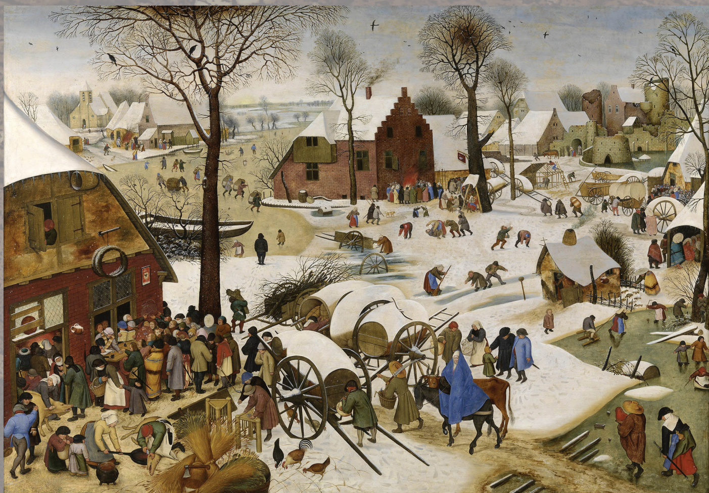
'Volkstelling te Bethlehem' Pieter Brueghel de Oude, 1566

10 december 2019, 47ste jaargang, nummer 43